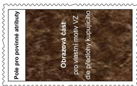
Obrázek č. 3 d) Maketa VZ orientované na výšku tištěné v úpravě ZS