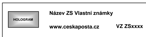
Obrázek č. 2 b) Maketa pole pro standardní označení ZS VZ