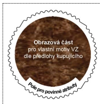
Obrázek č. 3 e) Maketa kruhové VZ tištěné v úpravě TL