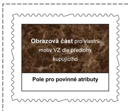
Obrázek č.3 b) Maketa obdélníkové VZ orientované na šířku tištěné v úpravě TL