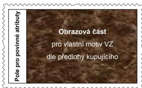
Obrázek č. 3 c) Maketa VZ s obrazovou částí orientovanou na šířku tištěné v úpravě ZS