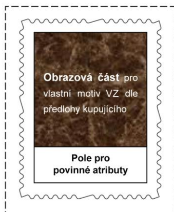
Obrázek č. 3 a) Maketa obdélníkové VZ orientované na výšku tištěné v úpravě TL